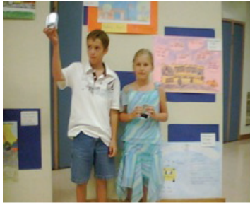
Bus Safety Poster Contest Winners

También el Departamento de Transportación SSSD ha tenido oportunidad de reconocer a los estudiantes por medio de su concurso anual de Póster de Seguridad en el Autobús el cual se lleva a cabo cada otoño. Se anima a que los estudiantes de todo el