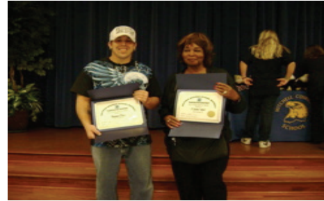
Parents receive recognition for keeping an eye out at the bus stops.

distrito participen y los ganadores reciben un premio especial y sus pósters son enmarcados y colocados en la Oficina de Transportación. Algo nuevo este año fue que el Departamento de Transportación reconocieron a los padres que no oficialmente estuvieron supervisando la parada de autobús cada mañana. Estos padres recibieron un certificado especial de apreciación durante la asamblea de reconocimiento en una de las escuelas.