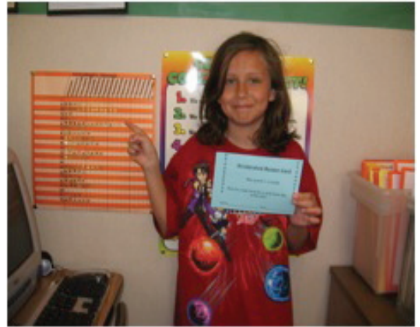
Students demonstrate reading progress as they work toward achieving their Accelerated Reader goal.

Estas son algunas de las maneras en que las Escuelas en el distrito Escolar Sulphur Springs celebra el éxito de sus estudiantes. Los estudiantes brillan cuando se llama su nombre y reciben su reconocimiento ya sea un lápiz, una medalla, un certificado, o tan solo un aplauso. Los padres se enorgullecen cuando sus niños