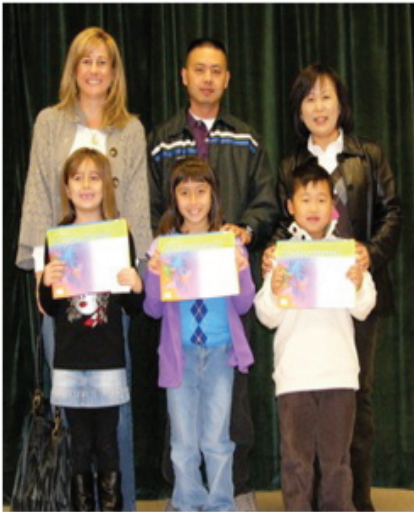
STAR Achievers at Fair Oaks Ranch Community School and their supportive parents are recognized for their outstanding achievement.

meta son reconocidos en una asamblea especial cada trimestre. Esta idea fue tan bien recibida en Golden Oak que se ha extendido a otras escuelas en el distrito ofreciendo el mismo reconocimiento a otros estudiantes y sus familias. Golden Oak invita a los estudiantes a un desayuno con pancakes servido por el director y los maestros. Los estudiantes quienes alcanzan su meta son invitados con sus familias a una Asamblea Especial de Medallas en donde se les entrega una medalla especial conmemorando su aprovechamiento. Los estudiantes son muy excitados por este programa y se les encuentra leyendo libros en cualquier momento libre que tengan! La circulación en la biblioteca ha mejorado y el programa Accelerated Reader es muy bien apoyado por la bibliotecaria en Golden Oak y en otras escuelas en el distrito.