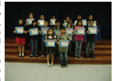
Good Citizens at Mitchell School

El personal del Distrito Escolar Sulphur Springs tiene historia de celebrar el éxito de los estudiantes por medio de asambleas de diplomas, recompensas a la clase e individualmente. El Distrito toma orgullo en si mismo al reconocer al personal especialmente por su larga trayectoria en el distrito escolar. Cada año la escuela abre con un desayuno de "Bienvenida!" en el cual los empleados reciben reconocimiento por su servicio al distrito. Los empleados nuevos en el distrito reciben un pin y quienes celebran sus 5, 10, 15 y 20 años en el distrito reciben un pin con el numero de año de servicio marcados. El personal quien ha estado en el distrito por 25 años reciben un pin con una manzana dorada y quienes tienen 30 años de servicio reciben una placa con una manzana de mármol y son llamados al stage para compartir algunos de sus recuerdos en el distrito. Esta celebración hace que el año empiece bien!