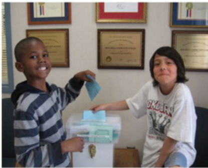
Students that have been "caught being good"!

distrito participen y los ganadores reciben un premio especial y sus pósters son enmarcados y colocados en la Oficina de Transportación. Algo nuevo este año fue que el Departamento de Transportación reconocieron a los padres que no oficialmente estuvieron supervisando la parada de autobús cada mañana. Estos padres recibieron un certificado especial de apreciación durante la asamblea de reconocimiento en una de las escuelas.