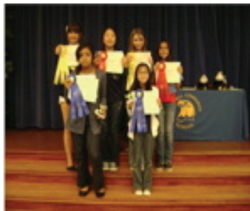
SSDTA Writing Contest Winner

Todas las Escuelas en el Distrito Escolar Sulphur Springs tienen asambleas, usualmente cada mes para reconocer a los estudiantes por ciudadanía, progreso académico, y carácter. La Escuela Comunitaria Mitchell se enfoca en un rasgo de carácter diferente cada mes como parte de el Programa, Carácter Cuenta! Los estudiantes son reconocidos por ser ejemplos brillantes en estos rasgos de carácter.